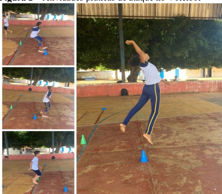
Figura 2 – Atividades práticas de ataque no Voleibol

avanços no aprendizado motor. Considerando que o ataque é um fundamento de maior complexidade e menos explorado no ensino inicial do voleibol, os discentes demonstraram entusiasmo ao vivenciarem tal prática, o que reforça a ideia de que a motivação e a inovação são fatores essenciais no processo educativo.