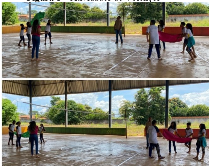
Figura 1 – Atividades de Volençaol

Na aula prática, iniciou-se com a atividade denominada “Volençaol” (Figura 1), na qual os alunos, organizados em equipes de quatro participantes, utilizavam panos para lançar e receber a bola sobre uma rede adaptada. Inicialmente, observaram-se dificuldades relacionadas à movimentação, uma vez que alguns estudantes permaneciam parados à espera de que a bola caísse diretamente sobre o pano. Contudo, após orientações voltadas aos deslocamentos e à comunicação entre os integrantes das equipes, a atividade tornou-se mais fluida, favorecendo a cooperação, a interação e a dinâmica do jogo.