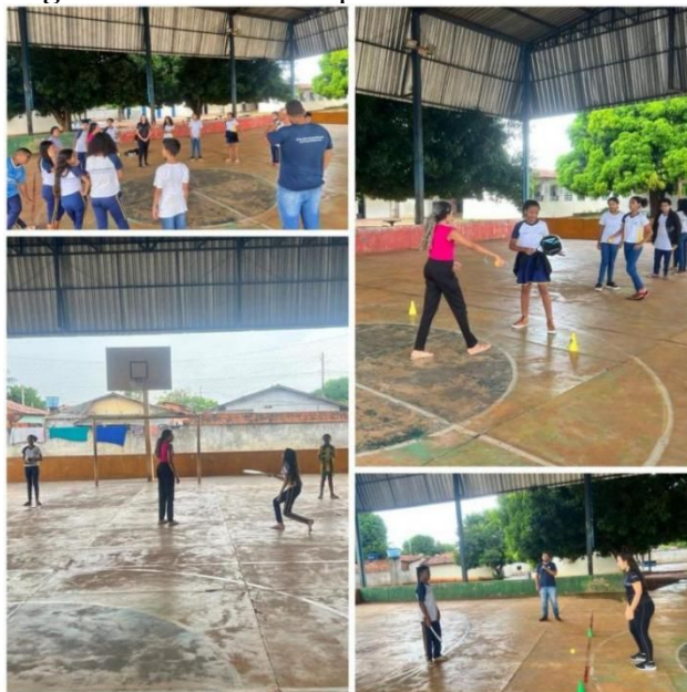
Figura 3 – Atividades práticas de Beach Tennis

alternadamente para ambos os lados; a cada lançamento, o estudante deveria responder com o golpe correspondente, de acordo com a direção da bola.