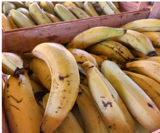
Figura 2. Estágio de maturação das bananas utilizadas para obtenção a farinha.

As bananas foram adquiridas na região. Para a produção da farinha utilizou-se a casca e a poupa do fruto (Figura 2). As bananas foram cortadas em fatias finas para auxiliar na pré-secagem ao sol, posteriormente foram levadas para estufa de ventilação forçada onde permaneceram por 48 horas a 55°C, para finalizar a secagem, em seguida foram moídas em moinho tipo Willey, com peneira de 2 mm.