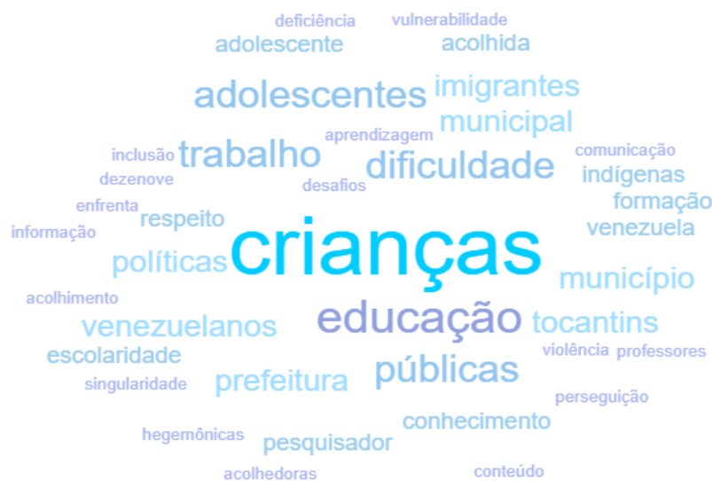
Imagem 2 - Nuvem de Palavras

Para continuar as análises, foi utilizado o software webQDA para criar uma nuvem de palavras, permitindo identificar as palavras mais mencionadas. Nesse contexto, as palavras mais recorrentes aparecem em tamanho maior e localizadas no centro da nuvem de palavras, reforçando a temática central alinhada aos objetivos propostos nesta pesquisa, conforme mostrado na imagem a seguir.