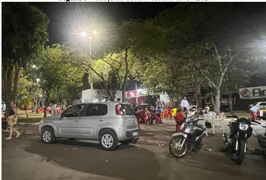
Figura 9 – Praça do Setor Noroeste 19/07/2024

Durante uma das noites de observação no “Espeto e Lanche Y”, no Setor Noroeste, o pesquisador notou uma cena que destacou as dinâmicas complexas entre vendedores ambulantes e clientes. Uma vendedora de bolos no pote, uma mulher (negra de aproximadamente 30 anos) aproximou-se de uma mesa onde um homem estava sentado sozinho, consumindo cerveja. O homem, que aparentava estar embriagado, lançou olhares persistentes e intrusivos na direção da vendedora enquanto ela se aproximava com seu produto.