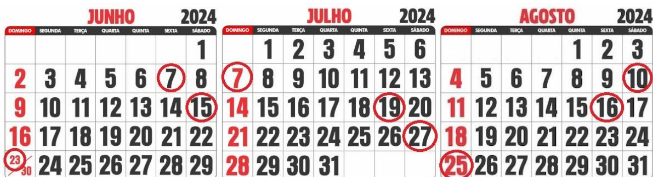
Figura 1 – Cronograma das observações realizadas no campo

As visitas ao campo ocorreram nos meses de junho, julho, e agosto de 2024, alternando entre sextas-feiras, sábados e domingos. Foram realizadas três vezes em cada um dos meses, alternando-se também entre os locais estudados durante os meses, que ocorreram conforme o quadro a seguir.