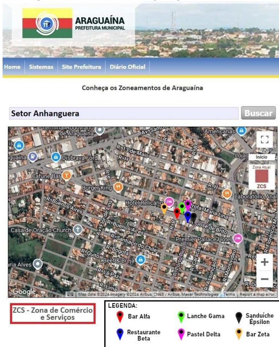
Figura 6 – Zoneamento do Setor Anhanguera a partir do site da SEPLAN