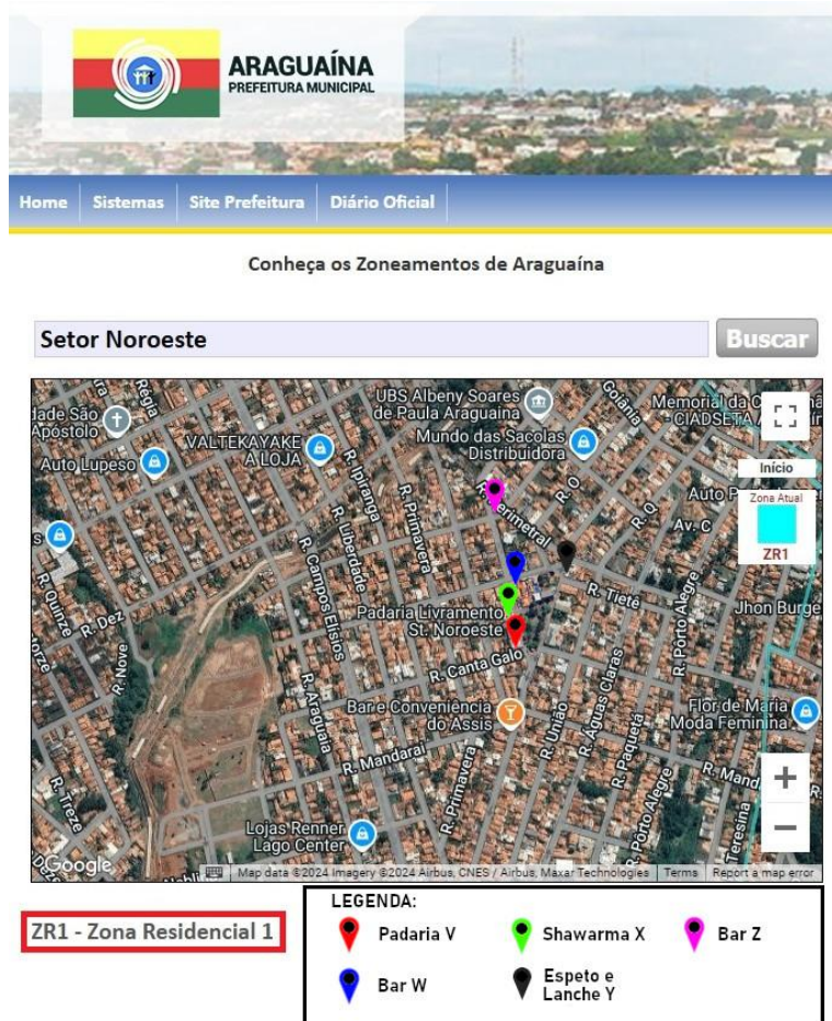
Figura 5 – Zoneamento do Setor Noroeste a partir do site da SEPLAN