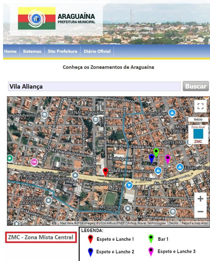
Figura 4 – Zoneamento da Vila Aliança a partir do site da SEPLAN