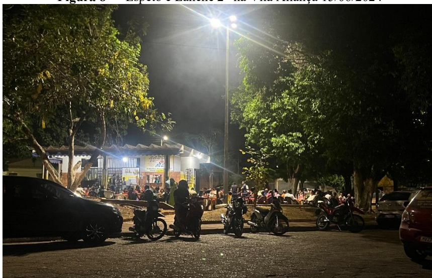
Figura 8 – “Espeto e Lanche 2” na Vila Aliança 15/06/2024

contexto de uma área mais residencial. As práticas dos ambulantes – como a escolha de produtos que refletem a diversidade e cultural local – foram vistas como formas de criar e comunicar significados que transcendem a simples transação comercial. O que coaduna com a visão de Hall (2016), quando diz que o ato de representar é essencial para a produção de sentido e identidade.