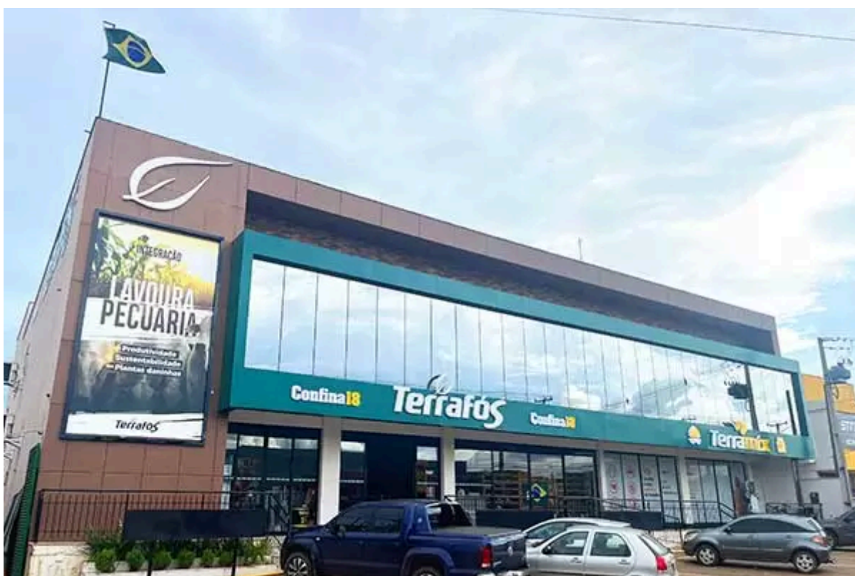
Figura 1. Fachada da Loja Matriz

Uma loja de renome e bem estabelecida, atende centenas de clientes todos os dias, e grande parte desses utiliza produtos fabricados por ela, que é de grande qualidade e mostra muitos bons resultados.