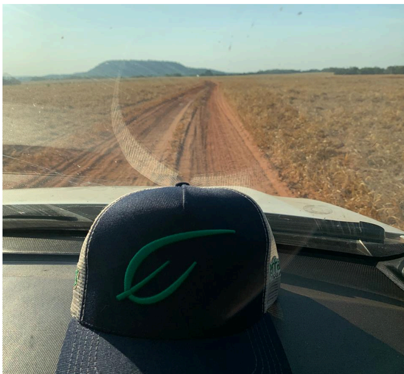
Figura 3. Viagem técnica.

As duas semanas seguintes, viajei junto aos técnicos da empresa (Figura 3 e 4), para fazenda no interior do Tocantins e Pará, a fim de dar assistência aos produtores clientes, além de prospectar novos clientes para a empresa, nessa fase, participei de coleta de solo, venda de produtos e resolução de problemas dos produtores rurais, além de conhecer novas regiões.