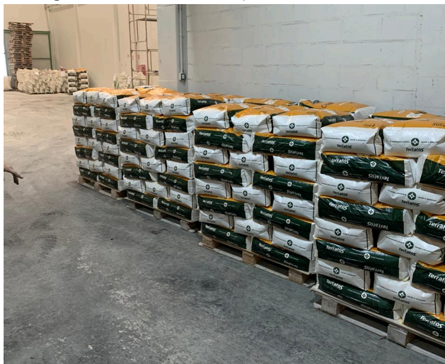
Figura 7. Sacos antes de ir para o armazenamento.