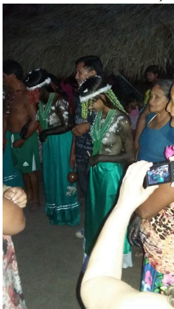
Figura 09: Dança e Cantoria das Meninas Moças com seus pares, 2016.

Fonte: arquivo pessoal, setembro de 2016.