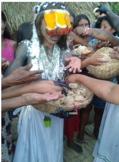
Figura 11: Distribuição de bolinhos de carne de caça para os convidados durante o encerramento da festa.

Fonte: Arquivo pessoal, setembro de 2016.