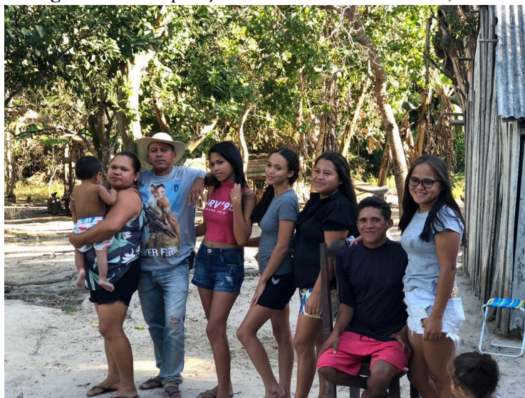
Figura 01: Composição da minha família nuclear, 2023.