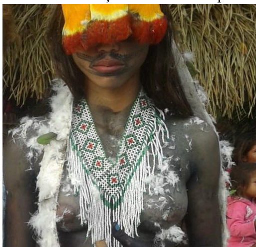
Figura 08: Corpo da Menina Moça adornado com pintura e enfeites, 2016.