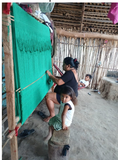
Figura 04: Maniá (rede) sendo confeccionado por uma Tenetehara, Aldeia Almesca, 2025.