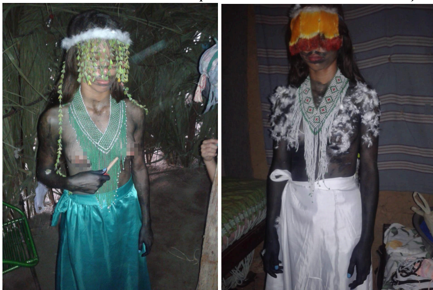
Figura 07: Enfeites e adornos no corpo durante a Festa da Menina Moça.

Fonte: Arquivo pessoal, setembro de 2016.