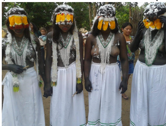
Figura 10: Moças durante o encerramento da festa de apresentação, 2016.