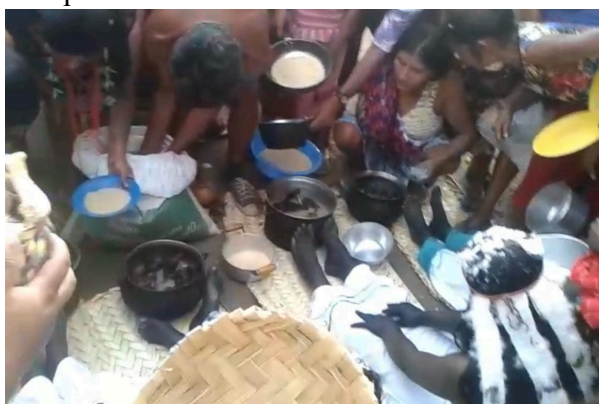
Figura 06: Carnes moqueadas sendo consumidas no encerramento da festa.