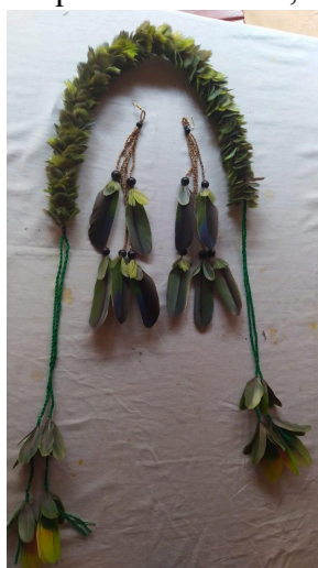
Figura 05: Tiara e Brincos do povo Tenetehara, Aldeia Juçaral, 2025.