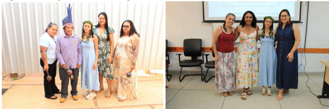
Figura 12: Registros da minha apresentação do TCC na UFNT de Tocantinópolis-TO.