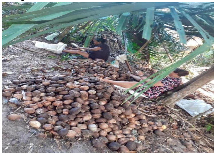
Figura 13- Quebradeira colocando o cabo no machado.

observado que há uma descontinuidade do trabalho da quebra do coco, devido à migração dos jovens para as cidades maiores, para estudar. Durante a pesquisa não foi observado a presença de mulheres jovens, nem dando suporte ou acompanhando as quebradeiras de coco. Por esse motivo, se percebe que essa prática passada de geração a geração é uma atividade que pode entrar em extinção nessa localidade.