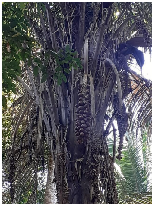
Figura 5- Palmeira de babaçu