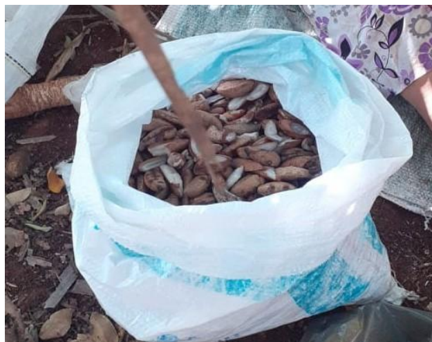
Figura 6- Amêndoas de coco babaçu quebradas durante o dia

Durante a quebra do coco é possível escutar um pouco de cada história já vivida por essas mulheres durante a estadia no mato, são inúmeras histórias, algumas perigosas e outras engraçadas, mas que elas sempre conseguem resolver e acabam ficando na memória.