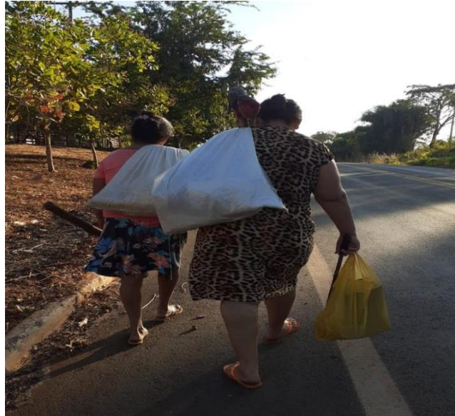
Figura 1- quebradeiras saindo para o babaçual

os dias, cada uma quebrando em sua residência.