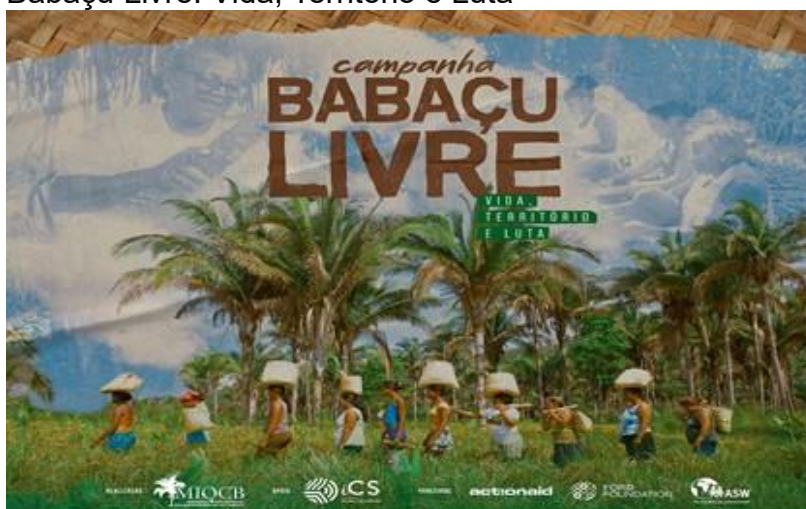
Figura-12 Banner de lançamento da campanha Babaçu Livre: Vida, Território e Luta

A Lei do Babaçu Livre está presente em quatro estados, Maranhão, Piauí , Tocantins e Pará. Existem 03 leis estaduais (Maranhão, Tocantins e Piauí) e 18 leis municipais (04 no Tocantins, 02 no Pará, e 12 no Maranhão). Recentemente em 2022, foi aprovada a lei estadual Babaçu Livre no estado do Tocantins (Lei nº 788/2022) 7 .