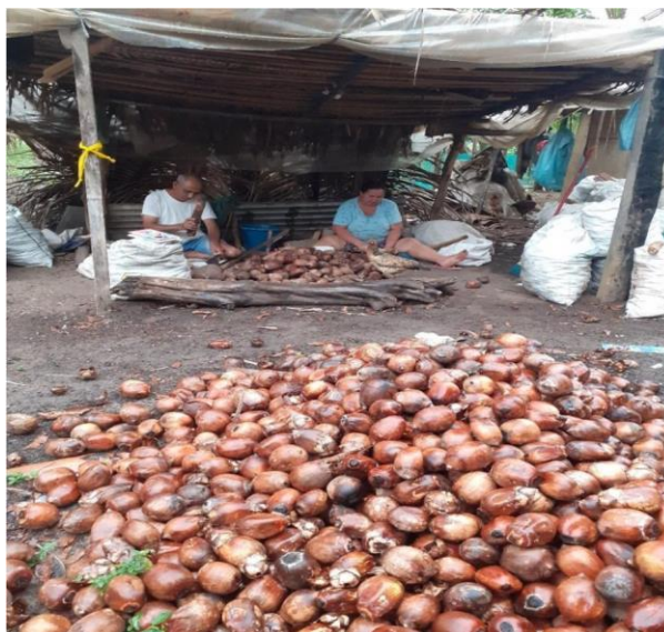
Figura 10- Quebrando coco na casinha