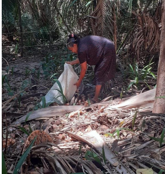
Figura 4- Dona juntando coco