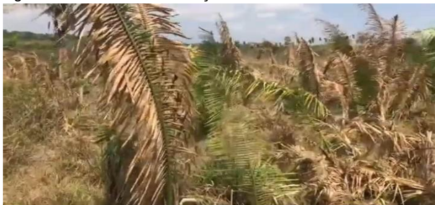
Figura 11- Pindobas de babaçu envenenadas

A expansão agrícola, muitas vezes impulsionada por interesses externos, levou à destruição de ecossistemas e à exploração desenfreada dos recursos naturais, afetando diretamente as comunidades locais, incluindo principalmente, as quebradeiras de coco babaçu. Com a expansão, veio a privatização das terras. As quebradeiras em suas constantes lutas centram-se em primeiro lugar, na conservação da mata dos cocais, pois diversos lugares estão sendo ameaçados pelo desenvolvimento de atividade agropecuárias em grande escala, como a derrubada das palmeiras, o envenenamento das pindobas (palmeiras que estão nascendo). Esses desmatamentos têm como destino final a formação de pastos, o que além de prejudicar o babaçu, faz com que o fruto fique escasso e extingue as reservas, aumentando a poluição e prejudicando a flora local, onde os animais nativos dependem para sobreviver. Com isso, os rios secam e o calor excessivo aumenta, afetando tanto os animais como os seres humanos.