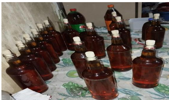
Figura 7- Azeite extraído do coco babaçu durante a semana