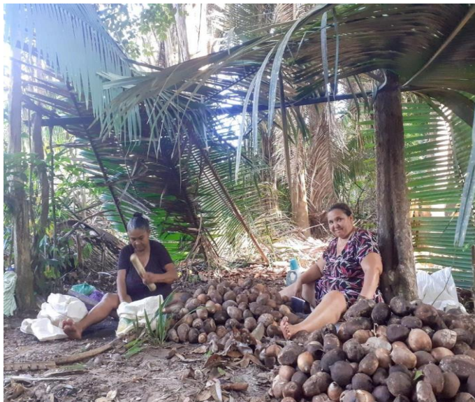
Figura 8- Mulheres quebradeiras de coco