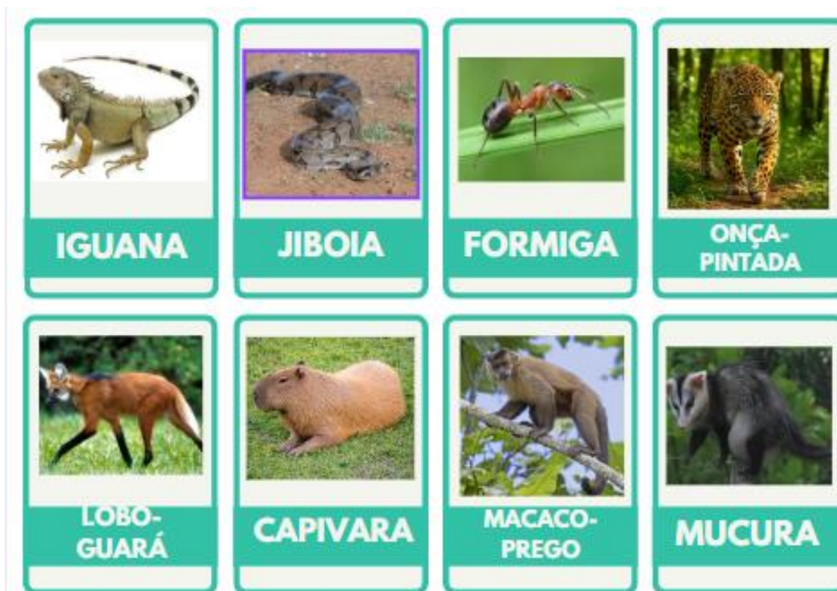
Figura 08: As 20 cartas que compõem o jogo “Cara-a-cara animal”

A seguir apresentamos a forma como as cartas foram materializadas: