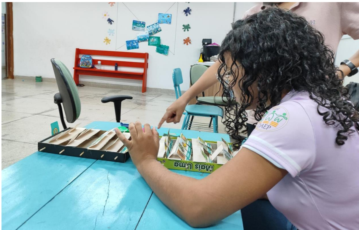
Figura 07: Monitora-brincante do Papu testando o jogo