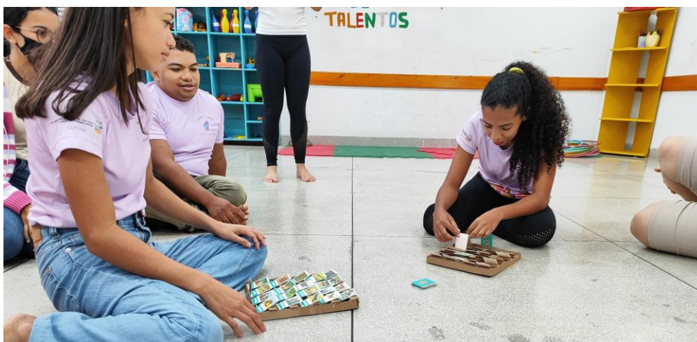
Figura 04: Monitoras-brincantes do PAPU testando o jogo Cara-a-cara Animal.

Abaixo seguem algumas imagens dos monitores brincantes testando o jogo “Cara-a-cara animal”: