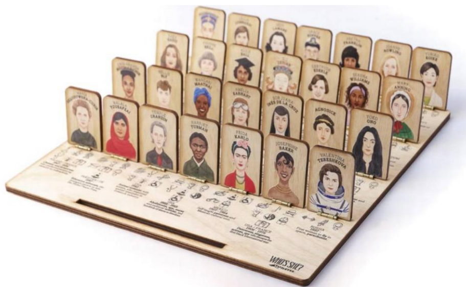
Figura 11: Jogo Who's She?

Fonte: https://oglobo.globo.com/brasil/artista-polonesa-cria-versao-feminista-do-jogo-cara-cara-23267888