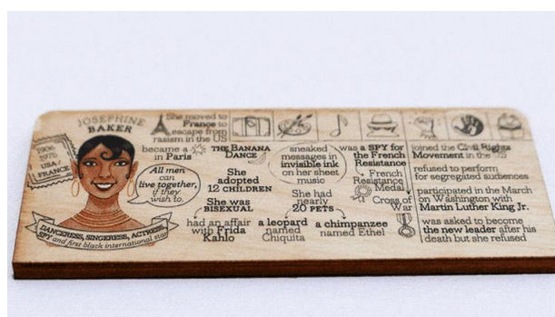
Imagem 12: Uma das peças biográficas do jogo Who's She?