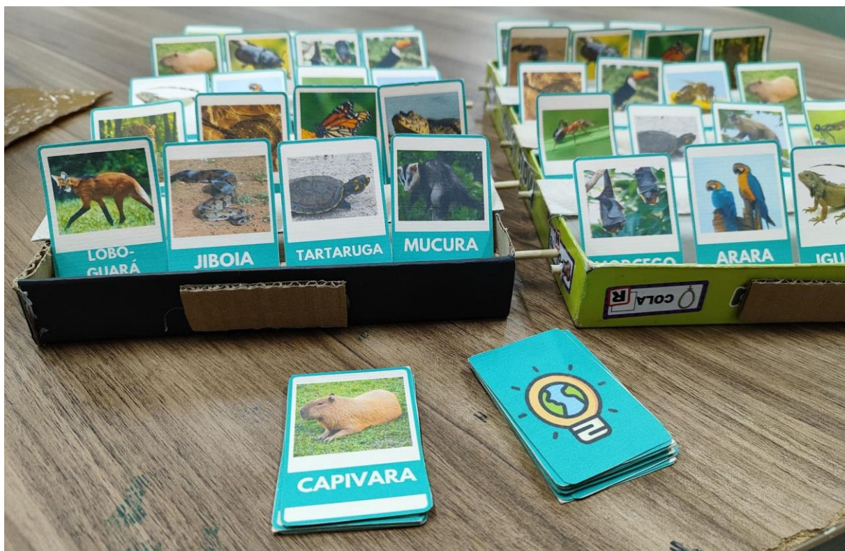
Figura 02: Fotografia do protótipo do jogo Cara-a-cara Animal, evidenciando os dois tabuleiros e as cartas.