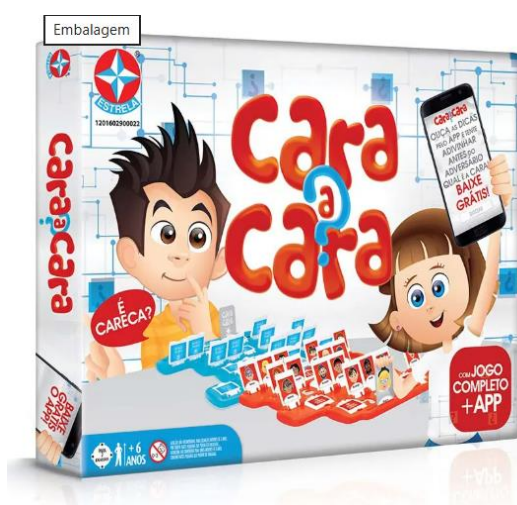
Figura 01: Caixa do jogo “Cara-a-cara” em sua versão original

O jogo original é composto por 24 figuras de rostos diversos. Cada jogador escolhe secretamente uma figura e tenta adivinhar a do oponente por meio de perguntas que só podem ser respondidas com "sim" ou "não". Trata-se de um jogo que vai muito além de uma simples brincadeira de adivinhação. Consiste em uma atividade lúdica que, quando bem explorada, contribui significativamente para o desenvolvimento de diversas competências cognitivas, linguísticas, sociais e perceptivas, especialmente em crianças em fase de desenvolvimento.