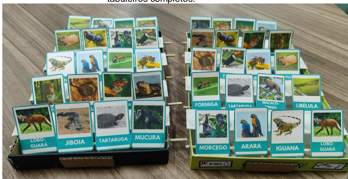
Figura 03: Fotografia do protótipo do jogo Cara-a-cara Animal, evidenciando os dois tabuleiros completos.