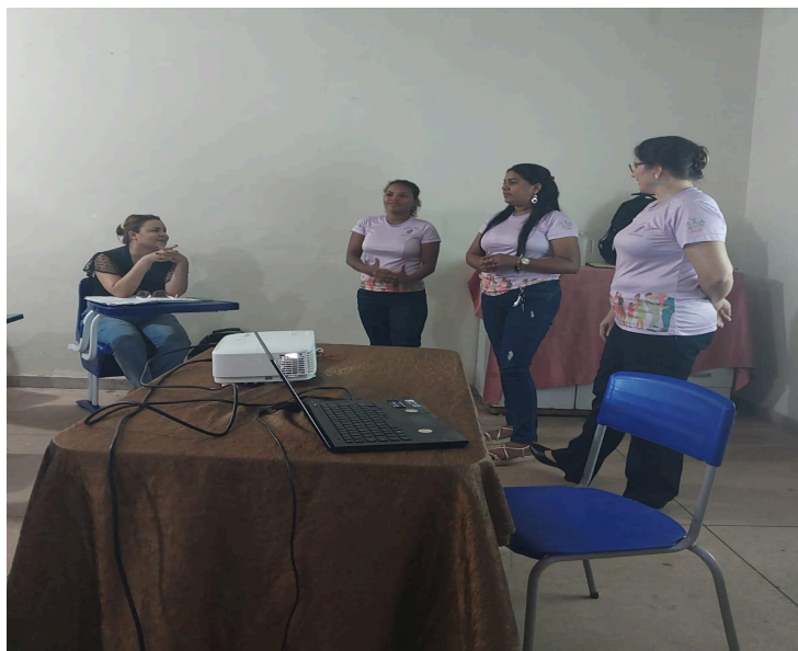
Figura 01: Visita de equipe do PAPU/UFNT à Escola para apresentar a política de apoio à parentalidade.