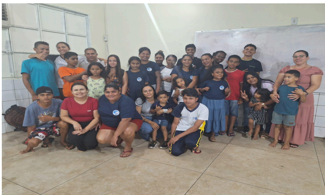
Figura 03: Foto de todos os alunos que participaram da pesquisa.

Diante da realização da leitura do meu prólogo, percebemos que algumas estudantes querem ir mais além após a conclusão do Ensino Médio, pude observar diante da fala de uma das estudantes: “Parabéns, eu também quero fazer a Universidade” , ou outro comentário como “sua história é linda!” , foram comentários que me deixaram feliz, feliz por saber que elas querem de alguma forma se libertar através dos estudos.