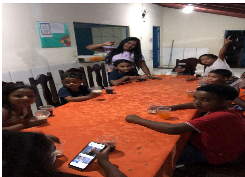
Figura 04: Confraternização com as crianças ao final das atividades.

As crianças tiveram reação positiva das atividades, mas o impacto do acolhimento na permanência das mães na EJA, apenas com a implementação de um programa específico na escola. As atividades foram finalizadas com pipoca e refrigerante juntamente com os seus respectivos responsáveis na cantina da escola.