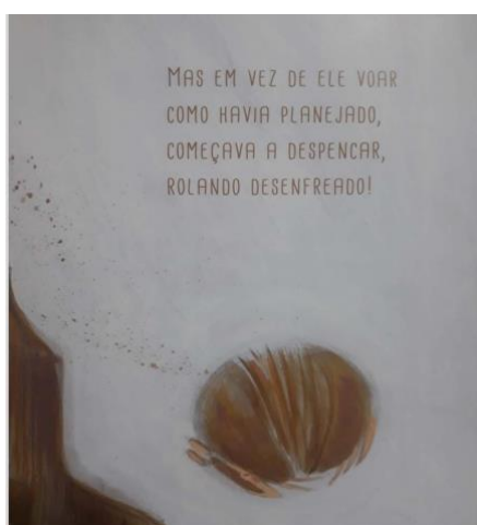
Figura 4: Frustração

Além disso, o aspecto visual do tatu-bola dentro de sua carapaça, vinculado ao verso: “tinha um sonho na cachola: não ser bola, ser balão!”, produz uma representação que reforça o desejo do personagem por liberdade e leveza. A carapaça, que representa restrição e dificuldade de ser quem ele realmente deseja ser, contrasta com o sonho de um balão flutuando no céu, que simboliza a liberdade e a leveza que ele busca. Essa oposição entre os elementos verbais e imagéticos é relevante para a compreensão da história, além de contribuir para o desenvolvimento da capacidade da criança de investigar, pensar, criar e interpretar. No fluxo de nosso trabalho, atentamos, na sequência, ao nosso segundo movimento de análise (a frustração):