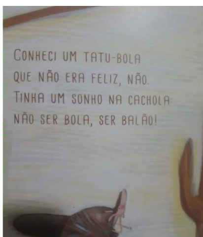
Figura 3: Sonho

De início, evidenciamos que, durante nosso fluxo de análise, a fim de proporcionar um melhor entendimento mobilizamos dois movimentos importantes a saber; descrição dos recortes selecionados e, posteriormente, interpretação, isto é, à análise em si. Cabe destacarmos que todos os recortes são configurados em formato figura, o que também deixa ver as ilustrações no livro. Nesse ponto, passamos o primeiro movimento de análise, atentamos, a seguir, ao primeiro recorte selecionado (o sonho):