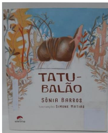
Figura 2: Capa do livro Tatu-balão

Consideremos, a seguir, a imagem da capa do livro Tatu-balão :