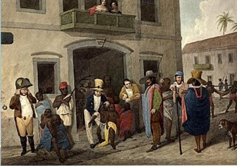
Fonte: Mercado de escravizados no Brasil. Augustus Earle, 1824.