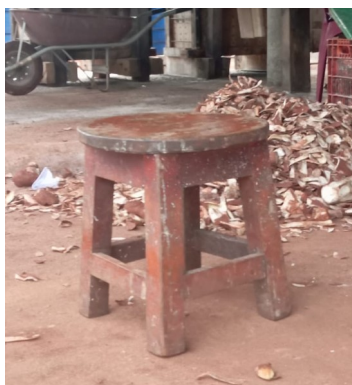
Figura 27. Tamborete

Figura 26 Faca: A lâmina é afiada o suficiente para cortar a casca dura da mandioca, que pode ser bastante resistente.