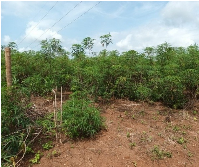
Figura 13 - Plantio de mandioca crescida

fase é fundamental para garantir uma boa formação das plantas, que dependerá de uma adequada gestão de irrigação, controle de pragas e fertilização.