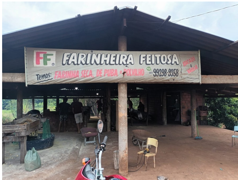
Figura 11 - Casa e/ou Forno de Farinha onde as mulheres descascam mandioca