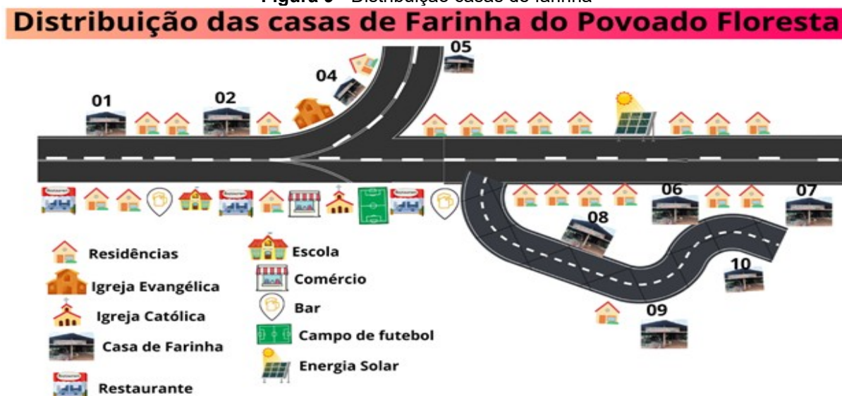
Figura 9 - Distribuição casas de farinha

sociologia em uma espécie de viagem de descoberta, onde o foco está na compreensão do processo e das nuances do cotidiano, em vez de tentar chegar a um ponto final fixo ou um "porto" de chegada definitiva. Assim, o objetivo é valorizar o percurso e a observação cuidadosa como forma de entender a complexidade da vida social.