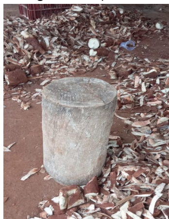
Figura 29. Cepo

Figura 28. madeira cortada utilizada como combustível. A lenha queima de forma a gerar um calor mais uniforme, o que é essencial para a torrefação da farinha, garantindo que todo o produto seja aquecido de maneira consistente