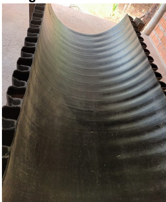
Figura 16 - Coxo