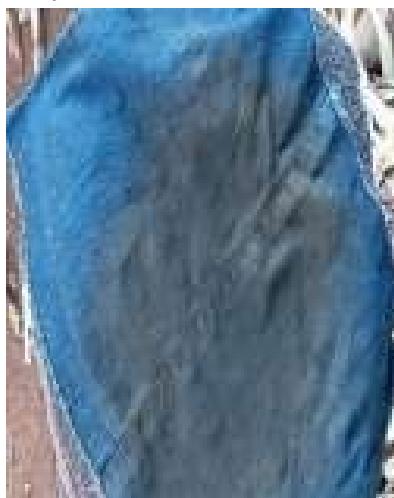
Figura 20 - Retalho de pano para apoiar a descascar mandioca depois de despontada