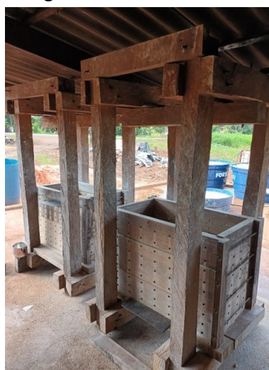
Figura 18. Prensa

Figura 17. Forno: O forno utilizado para assar a farinha, conhecido como forno de farinha ou forno de pão, é um equipamento tradicionalmente estruturado para garantir temperaturas controladas e uniformidade no cozimento. Construído com tijolos de barro cozido ou de cimento, o forno é projetado com uma câmara de queima onde se colocam brasas ou lenha. O revestimento interno é feito de argila ou barro resistente ao calor.