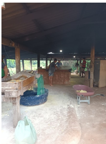
Figura 16. Banca com o motor do ralador

Figura.15. Coxo: É um recipiente grande e profundo, geralmente feito de madeira ou cimento, utilizado para colocar a mandioca após seu descasque. Ele serve como um local de armazenamento temporário durante o processamento da mandioca.