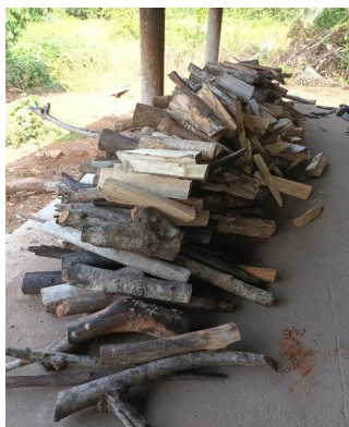
Figura 28. Lenha

Figura 27. Tamboretos: Assentos de madeira onde as trabalhadoras podem se sentar enquanto realizam as atividades na casa de farinha.