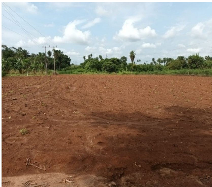
Figura 12 - Plantio de mandioca brotando

Quanto ao plantio da mandioca na comunidade, assim como em outras regiões, envolve práticas que se adaptam às condições climáticas e de solos locais. A mandioca é uma cultura bastante resistente e pode ser cultivada praticamente o ano todo, mas os períodos de plantio podem variar dependendo da região específica e das condições climáticas. Na comunidade pesquisada, o plantio geralmente ocorre na época de chuvas, de dezembro a março, quando o solo úmido favorece o enraizamento.