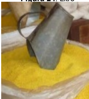
Figura 24. Litro

Figura 23. Carrinho de mão: Um equipamento prático para transportar a mandioca, a farinha e outros materiais dentro da casa de farinha. Facilita o Carrinho de mão: geralmente feito com estrutura de madeira reforçada com ferro ou aço, e rodas de madeira ou metal, montadas com pregos ou parafusos.