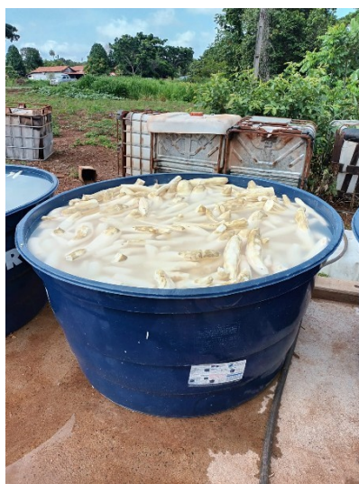
Figura. 20. Bacia/caixa d'água

Figura 19. Rodo de madeira: Um instrumento utilizado para ajudar a espalhar a massa ralada no forno e garantir que ela seque de maneira uniforme. O rodo é essencial para a manipulação e distribuição da mandioca durante o processo de secagem.