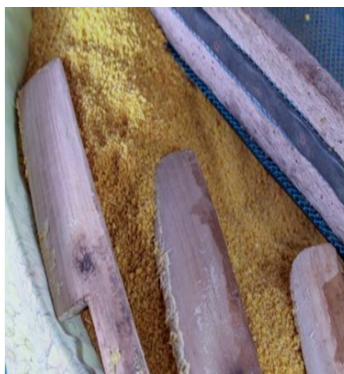
Figura 21. Faca de madeira