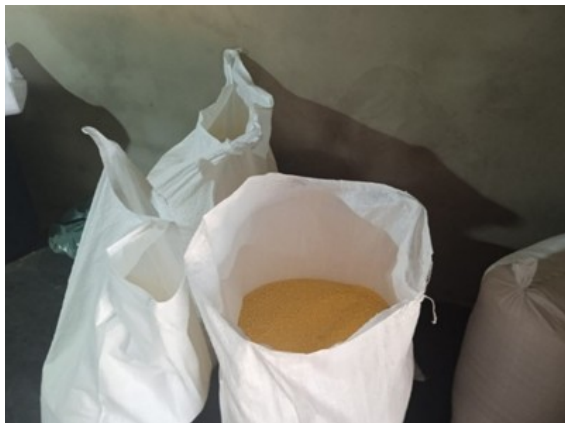
Figura 14 - Sacas de farinha produzidas