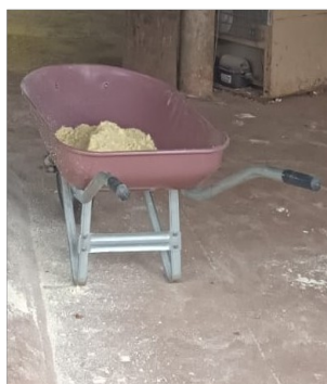
Figura 23. Carrinho de mão

Figura.22. Peneiras: Utilizadas para filtrar a farinha, removendo grumos e impurezas. As peneiras ajudam a garantir que a farinha tenha uma textura fina e uniforme.