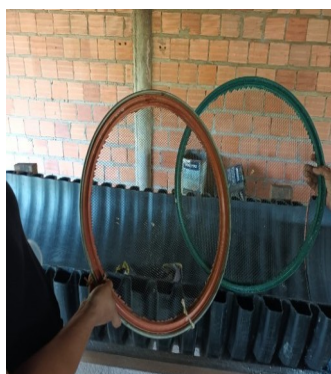
Figura 22. Peneira

Figura. 21. Faca de madeira: feitos a partir de troncos ou tábuas de madeira dura, A faca de madeira utilizada para espalhar a massa de mandioca no forno é um utensílio artesanal e funcional.