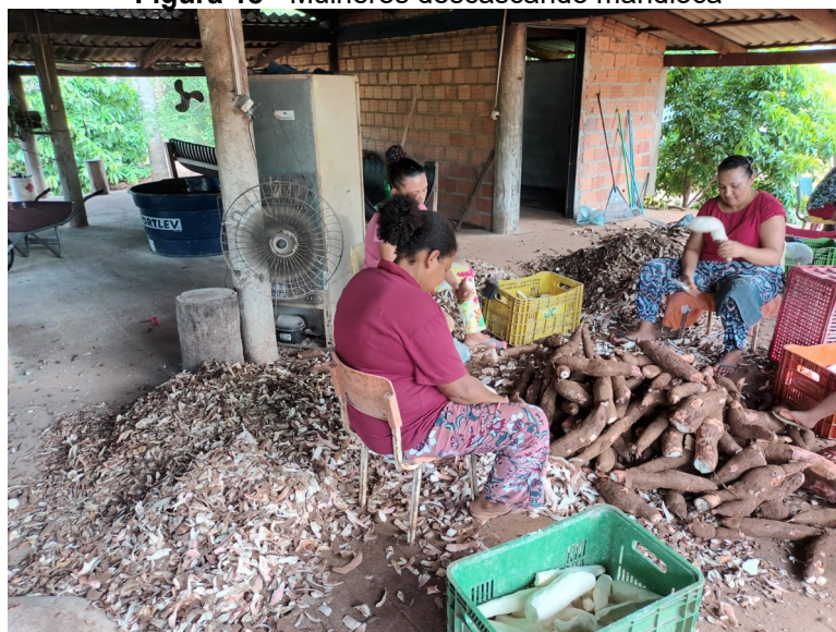
Figura 18 - Mulheres descascando mandioca

Nesse dia quando cheguei na casa de farinha já encontrei essas tres mulheres no processo de descascagem de mandioca, era por volta das 14h15min, me disseram que iam até as 21h para poder terminar no outro dia.