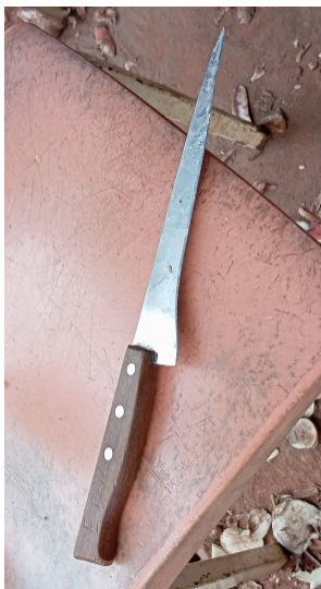
Figura 19 - Faca ponteaguda utilizada para descascar mandioca

mandioca depois de despontada para não sujar.