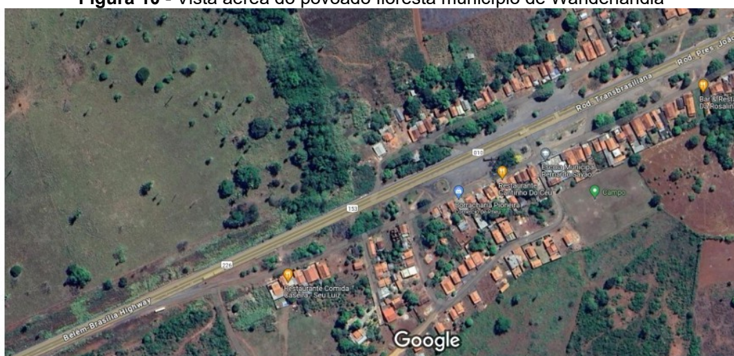
Figura 10 - Vista aérea do povoado floresta município de Wanderlândia