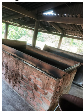
Figura 17. Forno