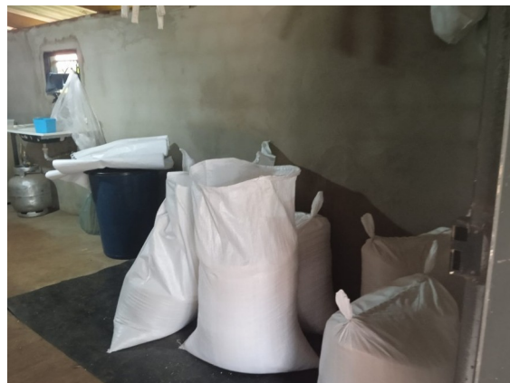
Figura 15 - Sacas de farinha produzidas