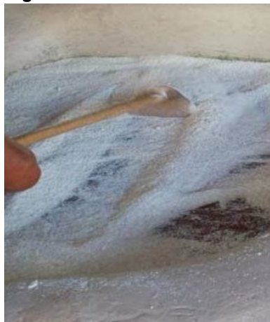
Figura 19. Rodo de madeira

extrair o excesso de líquido. Isso é importante para que a farinha não fique muito úmida, o que poderia comprometer sua conservação.