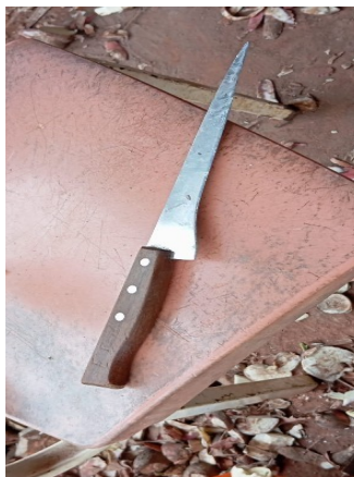
Figura 26. Faca lâmina