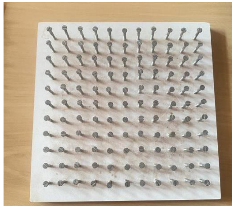
Figura 2 – Exemplo de Geoplano utilizado em sala de aula